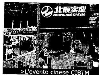
>L'evento cinese CIBTM

Dopo la chiusura con successo dell'edizione 2010 di GIBTM, il salone delle tecnologie per il settore degli eventi andato in scena ad Abu Dhabi dal 29 al 31 marzo scorsi, l'attenzione del comparto verso il mercato dell'est si sposta ancora più a oriente. Se la kermesse negli Emirati Arabi Uniti è stata l'occasione per presentare agli operatori del comparto la nuova applicazione per iPhone e iPod touch, chiamata iEvent e capace di gestire dallo smartphone ogni aspetto di un evento, la prossima manifestazione si preannuncia come una delle più