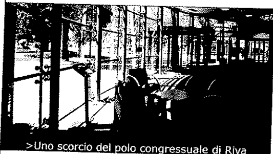
>Uno scorcio del polo congressuale di Riva